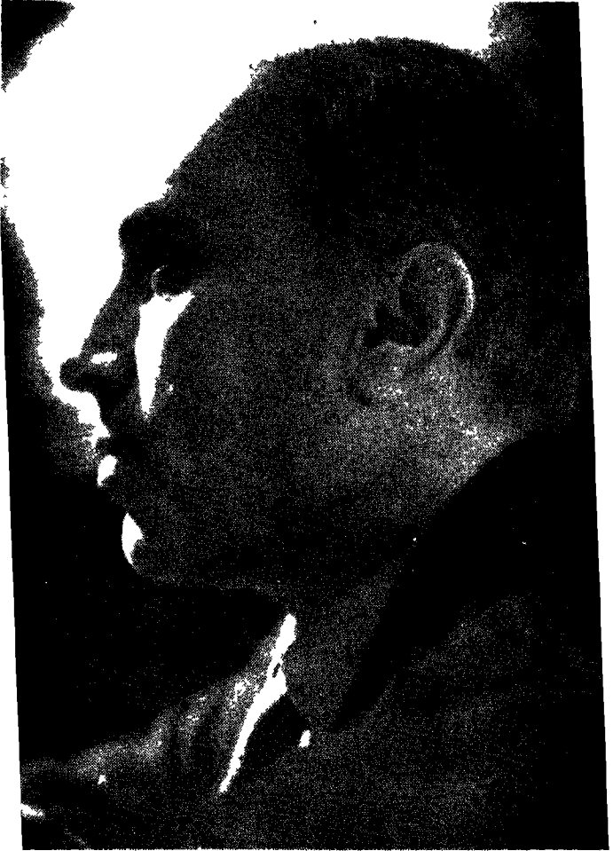
पण्डित जवाहरलाल नेहरू